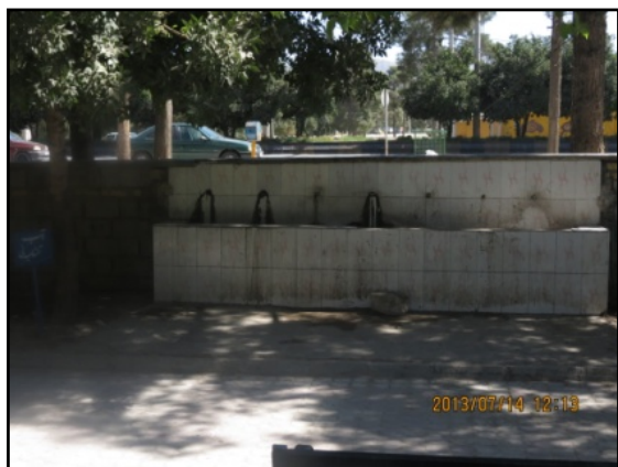
یافته‌های پژوهش. ۱۳۹۱

جغرافیدانان دریافته‌اند که ویژگی فضاهای پارک می‌تواند بر نوع استفاده از پارک تأثیر بگذارد. برای نمونه، تسهیلات و خدمات محدود و چشم‌اندازهای یک دست پارک، سطح استفاده از پارک را کاهش داده و یا مانع استفاده از تمام فضای پارک می‌شود. سرویس‌های بهداشتی کثیف و آلوده، تجهیزات ورزشی آسیب دیده، چمن و سبزه‌های له شده، گیاهان خشکیده، تسهیلات معیوب و لامپ‌های شکسته و ... ممکن است مانع استفاده شهروندان از تمامی امکانات پارک شود (Byrne, 2012: 297). از میان مکان‌ها و بخش‌های موجود در فضای پارک‌های شهری نورآباد که به شهروندان خدمات ارائه می‌دهند، بیشتر آن‌ها از نظر بهداشتی دارای مشکل و اکثراً دارای مناظری زشت و نازیبا می‌باشند (شکل شماره ۲).