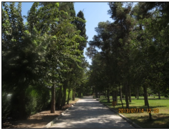
یافته‌های پژوهش. ۱۳۹۱

جغرافیدانان دریافته‌اند که ویژگی فضاهای پارک می‌تواند بر نوع استفاده از پارک تأثیر بگذارد. برای نمونه، تسهیلات و خدمات محدود و چشم‌اندازهای یک دست پارک، سطح استفاده از پارک را کاهش داده و یا مانع استفاده از تمام فضای پارک می‌شود. سرویس‌های بهداشتی کثیف و آلوده، تجهیزات ورزشی آسیب دیده، چمن و سبزه‌های له شده، گیاهان خشکیده، تسهیلات معیوب و لامپ‌های شکسته و ... ممکن است مانع استفاده شهروندان از تمامی امکانات پارک شود (Byrne, 2012: 297). از میان مکان‌ها و بخش‌های موجود در فضای پارک‌های شهری نورآباد که به شهروندان خدمات ارائه می‌دهند، بیشتر آن‌ها از نظر بهداشتی دارای مشکل و اکثراً دارای مناظری زشت و نازیبا می‌باشند (شکل شماره ۲).