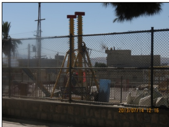
یافته‌های پژوهش. ۱۳۹۱

پارک‌ها و فضاهای سبز موجود در شهر نورآباد ممسنی به عنوان مرکز شهرستان به لحاظ ترجیحات مردمی دچار آسیب‌های خاصی می‌باشد و تنها یکی دو مورد از پارک‌های شهر مورد استفاده و استقبال شهروندان قرار می‌گیرد؛ در صورتی که فضای سبز و به‌خصوص پارک‌ها، جدای از ارزش‌های اکولوژیکی که برای شهرها دارند، دارای ارزش‌های اجتماعی می‌باشند و به‌عنوان محیط‌هایی که شهروندان برای فرار از استرس ناشی از محیط کار و خانه به چنین فضاهایی پناه می‌برند، شناخته می‌شوند. لذا می‌طلبید با شناخت ترجیحات مردم، فضای درون پارک‌ها بگونه‌ای برنامه‌ریزی شود که مطلوب نظر شهروندان باشد، تا استقبال از تمامی پارک‌های موجود در سطح این شهر در تمامی ساعات و در تمامی روزهای سال مورد استقبال شهروندان قرار گیرد.