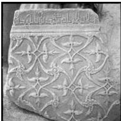
تصویر ۱۲: قابند تزئینی