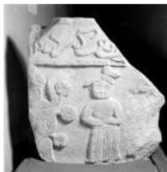
تصویر ۱۳: قابند تزئینی مرمر، صورت مغولی در کنار درخت