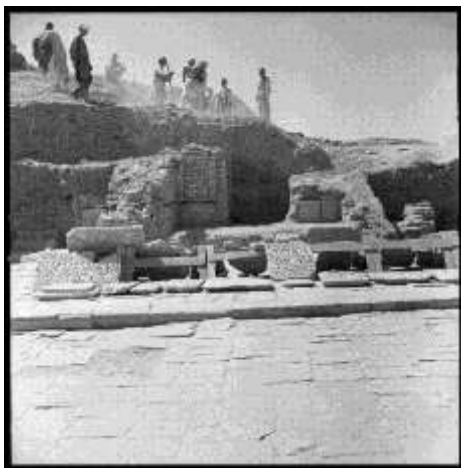
تصویر ۶: صحن کاخ مسعود سوم با کفپوش مرمری و ازاره‌های یافت شده