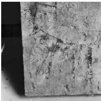
تصویر ۱۰: نگاره یک پرنده شکاری