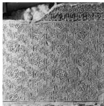
تصویر ۱۱: گچبری. نقوش هندسی شش ضلعی بر روی دیوار به همراه کتیبه