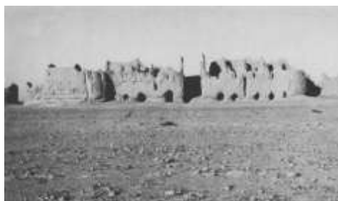
تصویر ۳: نمای کاخ مرکزی لشکری بازار