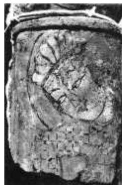
تصویر ۹: صورت مغولی بر یکی از ستون‌ها مأخذ: Schlumberger, 1952: 262