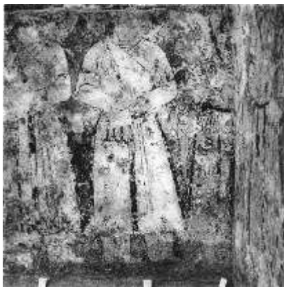
تصویر ۸: شمایل سربازان غزنوی بر روی نقاشی‌های ازاره