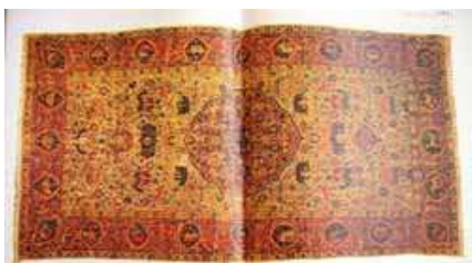
تصویر ۱۴. قالی سانگژکو با ترنج مرکزی و حیوانات در حال نبرد. ایران، قرن شانزدهم میلادی. مجموعه خصوصی

بخش اعظم قالی‌های هندی تولیدشده در خلال سلطنت اکبر و جهانگیر دارای طرح‌هایی بر اساس نظام گردش‌های گیاهی می‌باشند. طرح فرش با شاخه‌های گردان، تصویری برگرفته از طبیعت بوده و ضمیمه شدن نقوش حیوانی بر شبکه ای از شاخه‌های پیچان آن را از غنای بالاتری بهره‌مند ساخته است. قدمت این گروه از فرش‌ها اساساً به ربع اول قرن هفدهم دوران سلطنت جهانگیر باز می‌گردد. این‌ها به تبعیت از فرش‌های سانگژکو (Sangusko Carpets) ایران عهد صفوی تولید شده‌اند (تصویر ۱۴). نمونه هندی که متعلق به مجموعه خصوصی است بر خلاف نمونه‌های ایرانی، در عرض متقارن است و یک الگوی واحد، ۳ بار تکرار شده است. در میان شاخه‌های ختائی و پیچان، حیواناتی به صورت تک یا در حال نبرد نیز یافت می‌شوند. آن‌ها فاقد مشخصه طبیعت‌گرایی موجود در دو نمونه پیشین هستند (تصویر ۱۵).