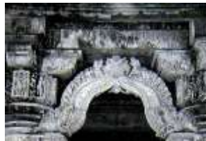
تصویر ۳. دروازه سنگی ماکارا - تورانا. معبد بودایی راجستان. قرن ۴ ق. ۵.

ویژگی تصاویر ماکارا و کیر تیموخوا در این است که اغلب با یکدیگر تلفیق شده و به دهان گرفتن و چنگ زدن بر چیزی را نمایش می دهند که می تواند الگوی نخستین برای ترکیبات حیوانی درهم پیچیده قالی های خیالی _ حیوانی باشند. نمایش تلفیقی حیوانات اساطیری در آثار هنری و کاربردی همان عهد از قبیل قوطی های باروت که به عنوان وسیله ای جانبی در کنار تفنگ به منظور مهیا ساختن آتش اسلحه بودند، قابل مشاهده است (تصویر ۵). در اغلب نمونه ها تزئینات شامل حیوانات در هم تنیده و ترکیباتی مشتمل بر خروج و دخول پیکره ها و پنجه کشیدن آن ها بر یکدیگر است، که به عنوان تزئین بر بدنه اصلی این جعبه باروت ها نقش بسته اند.