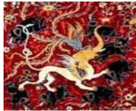
تصویر ۲۹. نبرد چندگانه. هفت فیل/ موجود فیل - شیر (گاجا سیمبا) / سیمرغ. بخشی از تصویر ۱۱

تدریج در ایران سبب گردیده است" (دانشپور پرور، ۱۳۷۶: ۶۶۴). در دوره اسلامی و با آمدن مغولان به ایران، ارتباط با هنر چین بار دیگر گسترش یافت. به دلیل آشنایی ایرانیان با هنر چین در عصر شکوفایی سلسله سونگ (۹۶۰-۱۲۷۹ میلادی) و سپس در عصر یوآن مغولی (۱۲۷۱-۱۳۶۸ میلادی) بسیاری از شیوه‌ها و سبک‌های هنری چین وارد هنر ایران شد و تأثیرات آن تا مدت‌ها باقی ماند و در زمان صفویه به اوج خود رسید. بدین ترتیب با ورود تأثیرات هنری ایران به هند الگوبرداری از چنین نقشی از سوی هنرمندان هندی گریز ناپذیر می‌نماید. قابل توجه‌ترین نبرد چندگانه در فرش تصویری زیبای بوستون (تصویر ۲۹) مشهود است که در حقیقت سه گروه حیوانی با یکدیگر در تعارض هستند.