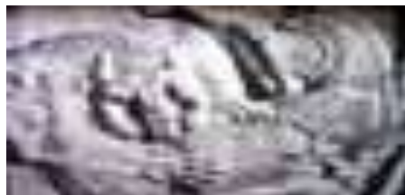
تصویر ۲۶. حمله شیر به ورزاب تخت جمشید.

تعلق دارد. این نقش که گرفت‌وگیر نام یافته هم یادآور نقش کهن باستانی معروف (تصویر ۲۶) و هم وجود انواع حیوانات در فردوس‌های باستانی است " (حصوری، ۱۳۸۵: ۳۲). اولین نقش ستیز شیر و گاو در ایران در حجاری‌های تخت جمشید به تصویر کشیده شد. " مفهوم این صحنه نبرد با جشن سالانه "ریپتوین" (Rapithwin) در ایران مرتبط بوده است. جشن ریپتوین بخشی از نوروز است؛ آمدن ریپتوین به زمین زمان شادی و امید به رستاخیز است، نمادی از پیروزی نهایی و همیشگی آفرینش نیک " (هینلز، ۱۳۷۳: ۴۶). کاربست نقوش مرتبط با مفاهیم باستانی در هنر ایران دوره اسلامی ادامه یافت و نبرد شیر و گاو نیز می‌تواند نمونه‌ای از این تداوم باشد. نقش نبرد گاو و شیر در فرش‌های هندی می‌تواند با اقتباس از فرش‌های ایرانی صورت پذیرفته باشد و در جزئیات نیز سعی شده از الگوی ایرانی پیروی نماید.