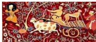
تصویر ۱۱. فرش با طرح تصویری . لاهور. ۱۶۰۰- ۱۵۹۰ م. موزه هنرهای زیبای بوستون.