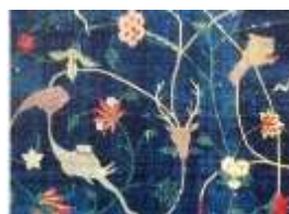
تصویر ۱۰- نمایش طبیعت‌گرایی بواسطه کاربست یک یا دو خط در میان رنگ اصلی بدن حیوان (بخشی از تصویر ۸)

آنچه که به‌عنوان ویژگی‌های بارز هندی در این فرش‌ها آشکار است، علیرغم نمایش پیکره‌هایی خارج از شکل متعارف، ایجاد عمق و یا شکل طبیعت‌گرایانه است. با وجود طراحی ضعیف، هنرمند با کاربست چند سایه رنگ و کشیدن یک یا دو خط در میان رنگ اصلی بدن حیوان تأثیر طبیعت‌گرایانه مدنظرش را برجای گذارده است (تصویر ۱۰). آغاز انعکاس این هیات‌های جانوری بر فرش‌های هند با علاقه و حمایت اکبر فرزند همایون رونق یافت و تا قرن هفدهم به حیات خویش ادامه داد.