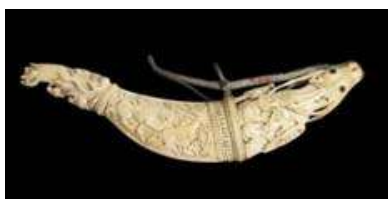
تصویر ۵. جعبه باروت. عهد مغول. عاج، کهربا و استیل. اواخر قرن ۱۲-۱۳ ه.ق

ویژگی تصاویر ماکارا و کیر تیموخوا در این است که اغلب با یکدیگر تلفیق شده و به دهان گرفتن و چنگ زدن بر چیزی را نمایش می دهند که می تواند الگوی نخستین برای ترکیبات حیوانی درهم پیچیده قالی های خیالی _ حیوانی باشند. نمایش تلفیقی حیوانات اساطیری در آثار هنری و کاربردی همان عهد از قبیل قوطی های باروت که به عنوان وسیله ای جانبی در کنار تفنگ به منظور مهیا ساختن آتش اسلحه بودند، قابل مشاهده است (تصویر ۵). در اغلب نمونه ها تزئینات شامل حیوانات در هم تنیده و ترکیباتی مشتمل بر خروج و دخول پیکره ها و پنجه کشیدن آن ها بر یکدیگر است، که به عنوان تزئین بر بدنه اصلی این جعبه باروت ها نقش بسته اند.