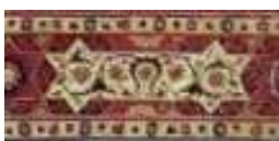
تصویر ۲۰. بخشی از تصویر ۱۳