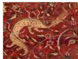
تصویر ۲۷. بخشی از تصویر ۱۶

اژدها جانور افسانه‌ای بزرگی است که معمولاً به شکل سوسمار یا مار غول‌پیکر فلس‌دار با بال خفاش‌مانند و نفس آتشین و دم نوک‌تیز مجسم می‌شود (موسوی، ۱۳۸۶: ۷۷۷). بسیاری از پژوهشگران خاستگاه نقش اژدها را چین می‌دانند که به واسطه روابط اقتصادی- فرهنگی میان چین و ایران وارد فرهنگ و هنر ایران شده است. " ارتباط مستقیم بین ایران و چین از دوره هان (۲۰۲ ق.م - ۲۲۰ م) تقریباً هم‌زمان با سلسله اشکانی آغاز شده است و یکی از علل تداوم این ارتباط ورود کالاهای چینی به ویژه پارچه‌های پشمین نقش‌دار بوده که بی‌تردید انتقال این اندیشه را به-