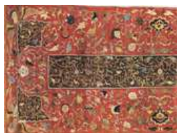
تصویر ۹. بخشی از یک فرش مربوط به کاشان . قرن دهم . مجموعه گلبنکیان. (Alkouffe&Bernus, 1996: 105)

همچنین ساختار مشابه با نمونه‌های هندی متعلق به جهانگیر، در قالی کاشان متعلق به قرن دهم ه.ق مشهود است که در آن از نقش واق با گونه نخست که شامل ترکیب سر انسان با ساختار گیاهی پیچان می‌باشد استفاده شده است (تصویر ۹).