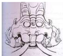
تصویر ۴. کیر تیموخوا ( کالا موخا).