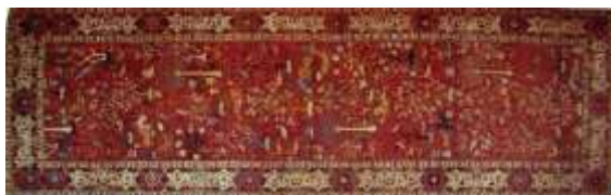
تصویر ۱۳. فرش با طرح تصویری. لاهور. اواخر قرن شانزدهم و اوایل قرن هفدهم میلادی. موزه هنر متروپلیتن. نیویورک.

فرش مورگان نمونه دیگری از فرش‌های تصویری اواخر قرن شانزدهم یا اوایل قرن هفدهم می‌باشد که در شمال شبه قاره هند بافته شده و از طرف شخصی به نام ج. پیرپونت مورگان ( J. Pier Pont Morgan) به موزه متروپلیتن (Metropolitan Museum) اهدا گردید. طول زیاد فرش این امکان را به طراح بخشیده که طرح اصلی را در قالب یک الگوی واحد طراحی و آن را در راستای ۸۵۷ سانتیمتر تکرار نماید و این تکرار تنها در طول قالی اما معکوس صورت پذیرفته و به همین دلیل طرح فرش تصویری به نظر می‌رسد. این قالی از نظر تراکم پوشش گیاهی و تلفیق آن با جانوران، طرحی شبیه به فرش طاووس موزه وین دارد اما حیوانات چهارپا واقع‌گرایانه در حال جست و خیز و درخت نخل نیز بر آن اضافه شده است (تصویر ۱۳).