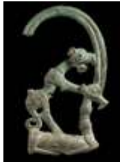
تصویر ۷. دسته مفرغی. از لرستان. قرن ۴-۷ ق.م. موزه هنرهای زیبای بوستون

را در نقش ها و تزئینات خویش از آشور و ایران گرفته و بیهوده نیست که هنر ایرانی از روزگاران کهن و سپس در دوره اسلامی از نظر تزئینات حیوانی بسیار غنی بوده است " (محمد حسن، ۱۳۸۸: ۲۴۵).