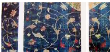
تصویر ۸. قطعاتی از فرش با طرح شاخه های گیاهی و سرهای حیوانی. لاهور. ۲۰-۱۶۱۰ م. موزه هنر های تزئینی پاریس.