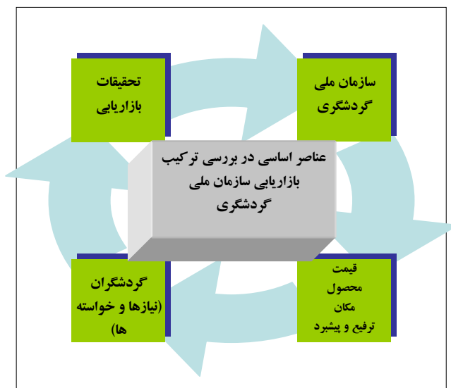
شکل ۲: عناصر اساسی در بررسی ترکیب بازاریابی سازمان ملی گردشگری مأخذ مطالب: (اسلام، ۱۳۸۲: ۲۷۵) تهیه شکل: پژوهشگران

مهمترین هدف بازاریابی گردشگری داخلی جلب هر چه بیشتر دیدارکنندگان از منطقه‌ای خاص است. به همین دلیل باید تصویر روشنی از امکانات، جاذبه‌ها و چگونگی دسترسی به آنها را فراهم آورد.