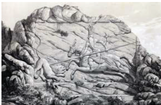
تصویر ۷- کوه سرسره، نقش شکار شیر، طرح از اوژن فلاندن.

در هر دو نقش، شاه در میانه تصویر باشکوه و عظمت بر تخت سلطنت نشسته است. در نقش برجسته ساسانی ۴ تن از درباریان در اطراف بهرام اول ایستاده‌اند. در نقش برجسته چشمه علی ۱۰ نفر از شاهزادگان و درباریان در اطراف پادشاه حضور دارند و به تبعیت از پرسپکتیو مقامی پادشاه بزرگ‌تر از بقیه به تصویر درآمده‌اند. در نقش برجسته چشمه علی و نقش تنگه واشی، همه شاهزادگان