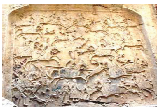
تصویر ۴- فیروزکوه، تنگه واشی، (مأخذ: behtarinha.ir)