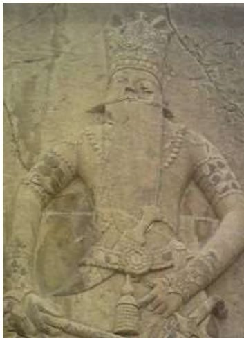
تصویر ۳- چهره فتحعلی شاه بخشی از اثر نقش برجسته در شهر ری.

آرکائیسم از مؤلفه‌های جدید برای نوسازی ایران به حساب می‌آید و در پی آن است تا با احیا و تجدید حیات سنت‌ها و عقاید کهن و باستانی، نظم جدیدی را در تفکر اجتماعی، فرهنگی و سیاسی بازتولید کند و زیرساخت‌های فرهنگی و اجتماعی نوین را بر پایه سنت‌های کهن بنا نهد» (بیگلو، ۱۳۸۰، ۱۹). ریشه‌های شکل‌گیری گرایش فتحعلی شاه به هنر و فرهنگ باستانی را می‌توان در دوران ولیعهدی وی جست‌وجو کرد. در آن زمان فتحعلی خان والی شیراز بود و زیر نظر عمومی خود دوران ولیعهدی خود را می‌گذراند. او دوران بلوغ فکریش را در مهد آثار باستانی و تاریخ گذشته ایران سپری کرد و طبیعتاً تحت تأثیر فضای فرهنگی آن دیار قرار گرفت. «شیراز که نماد پارس باستان و یکی از مراکز رشد فرهنگ و هنر ایران به حساب می‌آمد و دارای مکانی ویژه و متعالی در حوزه هنر ایران، خاصه ادبیات و نگارگری بود و مهد شاعران، بی‌شک تأثیرات بنیادینی در ذهن و روح هر انسان هنردوستی باقی می‌گذاشت» (علی محمدی اردکانی، ۱۳۹۲، ۵۶). در بررسی علل شکل‌گیری اندیشه باستان‌گرایی در زمان سلطنت فتحعلی شاه می‌توان، سبب رجوع دولت به این نگرش را فرارگرفتن سلطنت حاکمه در موضع