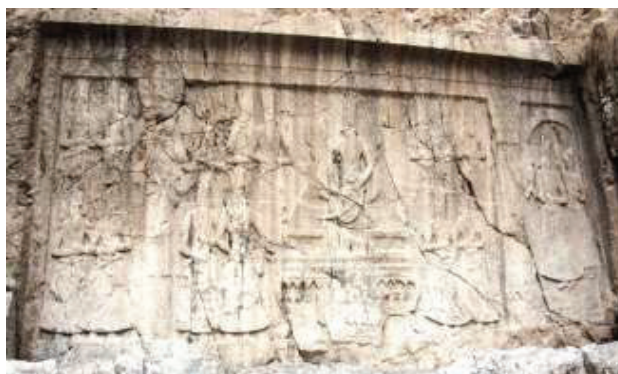
تصویر ۸- فتحعلی‌شاه نشسته بر تخت، صخره‌نگاره چشمه علی، شهر ری، تهران (مأخذ: نگارنده، آرشیو شخصی، ۱۳۹۲).