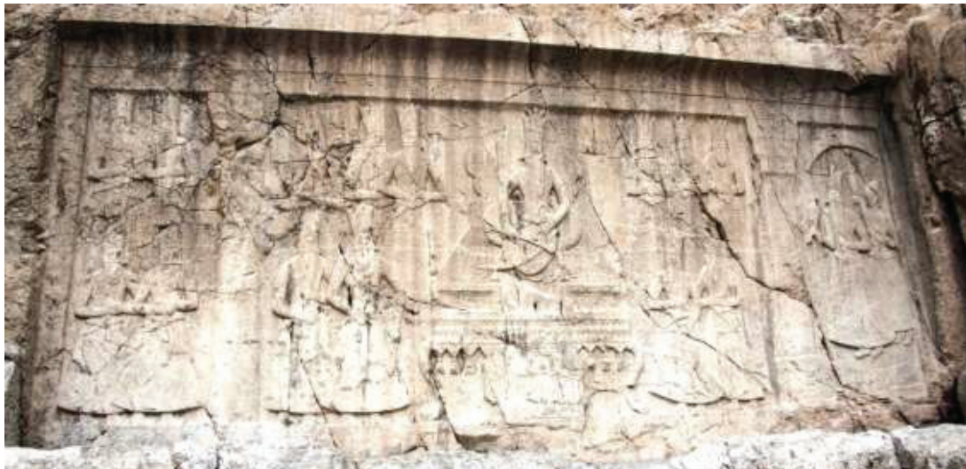
تصویر ۲- فتحعلی شاه نشسته بر تخت، صخره نگاره چشم علی، شهر ری، تهران (مأخذ: نگارنده، آرشیو شخصی ۱۳۹۳).