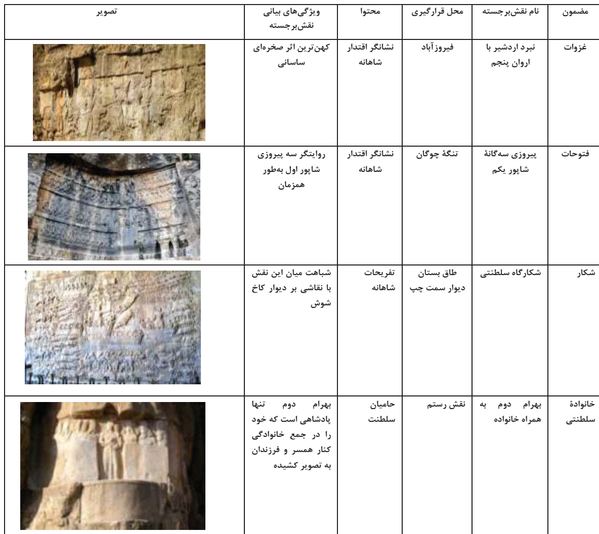
جدول ۱- تقسیم‌بندی موضوعی نقش‌برجسته‌های دوره ساسانی. تدوین: نگارنده.

زمان هخامنشیان جان گرفت و چون ساسانیان در پی احیای سنت‌های هخامنشی بودند، این هنر را در راستای اهداف سیاسی و تبلیغاتی به اوج خود رساندند. بدین ترتیب این سنگ‌نگاره‌ها برای هر چه قدرتمندتر نشان دادن پادشاهان ساسانی و به تحقق رسیدن اهداف این شاهان بسیار مناسب بود. نقوش برجسته متعددی که از دوره ساسانی بر جای مانده، با گذشت بیش از یک هزاره، همچنان حیرت‌آور و باصلاط است و مخاطب را از وجودش متحیر می‌سازد. در حال حاضر ۳۷ نقش برجسته صخره‌ای از این دوره شناسایی شده است. ۲۹ نقش برجسته در استان فارس قرار دارد که دو نقش در منطقه فیروزآباد، ۶ نقش در تنگه واشی، ۲ نقش در دارابگرد، ۷ نقش در نقش رستم، ۳ نقش در نقش رجب و ۳ نقش در برم دلك باقی مانده. همچنین ۶ نقش در طاق بستان کرمانشاه و یک نقش در منطقه سلماس، آذربایجان غربی قرار دارد. سنگ‌نگاره‌ای نیز در شهر ری بر کوه سرسره قرار داشت که متأسفانه از بین رفته است. مضامین عمده این نقش‌برجسته‌ها عبارت‌اند از: ۱- غزوات ۲- فتوحات ۳- شکار ۴- خانواده سلطنتی ۵- تاج‌ستانی از جانب پروردگار. در جدول ۱ به طبقه‌بندی این حجاری‌ها پرداخته شده است که براساس پنج موضوع غالب انتخاب شد (جدول ۱).