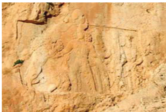
تصویر ۶- سرمشهد، نقش برجسته بهرام دوم در مقابله با حمله شیر.