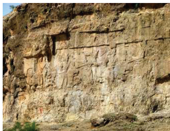
تصویر ۱، فیروزآباد، پیروزی اردشیر یکم بر اردوان پنجم، سده سوم، مأخذ: (wikipedia.org).

این حجاری‌ها دارای مضامین؛ اعطای منصب پادشاهی، غلبه بر دشمنان و فتح و پیروزی، شاه در شکارگاه، شاه در ارتباط با شخصیت‌های مقدس، نبرد با شیر و تصویر پادشاه با افراد خانواده خود و درباریان هستند. این نقوش اغلب با جزئیات بسیار کم و به‌صورت نمادین طراحی شده‌اند؛ برای مثال در صحنه‌ای از نبرد شاه با دشمنان در نقش‌برجسته پیروزی اردشیر بر اردوان پنجم در فیروزآباد (تصویر ۱) تنها فریمی از صحنه مغلوب‌شدن دشمن بر شاه و نشان‌دادن قدرت، شکوه و جلال این پیروزی به‌صورتی کاملاً سمبلیک به تصویر کشیده شده است. یا نقش‌های اهدای فرّ ایزدی توسط ایزد یا ایزدبانو یا اهورامزدا به پادشاه به‌طور سمبلیک نشان‌دهنده مشروعیت سلطنت این پادشاهان در این سرزمین