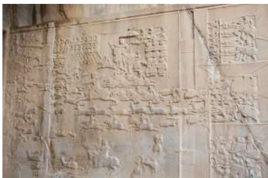
تصویر ۵- طاق بستان، ایوان بزرگ، دیتیلی از نقش برجسته شکار گوزن، (عکس از نگارنده، آرشیو شخصی، ۱۳۸۸)

با بررسی جزئیات در این دو نقش می توان پی برد که نقش برجسته تنگه واشی از جهت بسیاری متأثر از نقش شکار طاق بستان است. در وهله اول تشابه مضامین این دو نقش قابل توجه است. وجود شاه به عنوان نفر اول نقش به همراه ملازمان خود، رعایت پرسپکتیو مقامی به طوری که شاه در هر دو حجاری بزرگ تر از سایرین به نقش در آمده، قابل توجه است. جزئی نگری و دقت فراوان در اجرای صحنه شکار و افراد و ملازمان که در حجاری طاق بستان در اجرای صحنه جزئیات شکارگاه قابل رؤیت است، در حجاری تنگه واشی این وسواس را می توان در نقش افراد و دقت بالا در رعایت جزئیات لباس ها دید. از ویژگی های مهم هر دو نقش انتقال حرکت و نشان دادن صحنه ای پر جوش و خروش است. تفاوت هایی نیز در این دو نقش دیده می شود. که در اینجا به ۳ تفاوت اساسی اشاره می شود. حجاری تنگه واشی با الگوبرداری از حجاری طاق بستان در بستر اجتماعی، فرهنگی جامعه خویش با وجود سنن قجری و مظاهر و ابزارهای جدید شکل گرفته است. یکی از تفاوت های بارز این دو نقش را می توان به نبود حضور بانوان در حجاری تنگه واشی و وجود ابزارآلات شکار جدید مانند تپانچه در کنار سلاح سرد مانند شمشیر و نیزه و همچنین وجود سگ تازی در صحنه شکارگاه در حجاری تنگه واشی اشاره