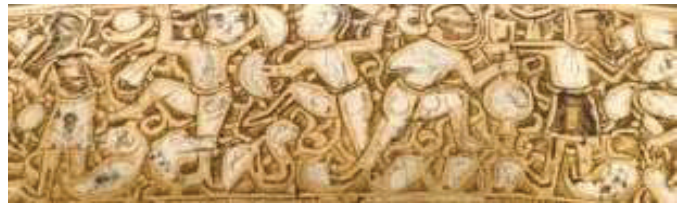
تصویر ۴- جام با کتیبه تصویری، با قالب برنج، منبت‌کاری شده با نقره، قرن ۱۳، دوره سلجوقی، ایران، مأخذ: www.clevelandart.org .

به‌راستی معانی سرزندگی و نشاط در میان مردمان و القای آن به مالک و استفاده‌کنندگان از ظرف را دارد و نقش تداعی‌کننده حروف نوشتاری به‌وسیله نقوش انسانی و حیوانی و پرندگان در این اثر نیز به حس پویایی و تحرک بسیار این کتیبه تصویری افزوده است (تصویر ۴).