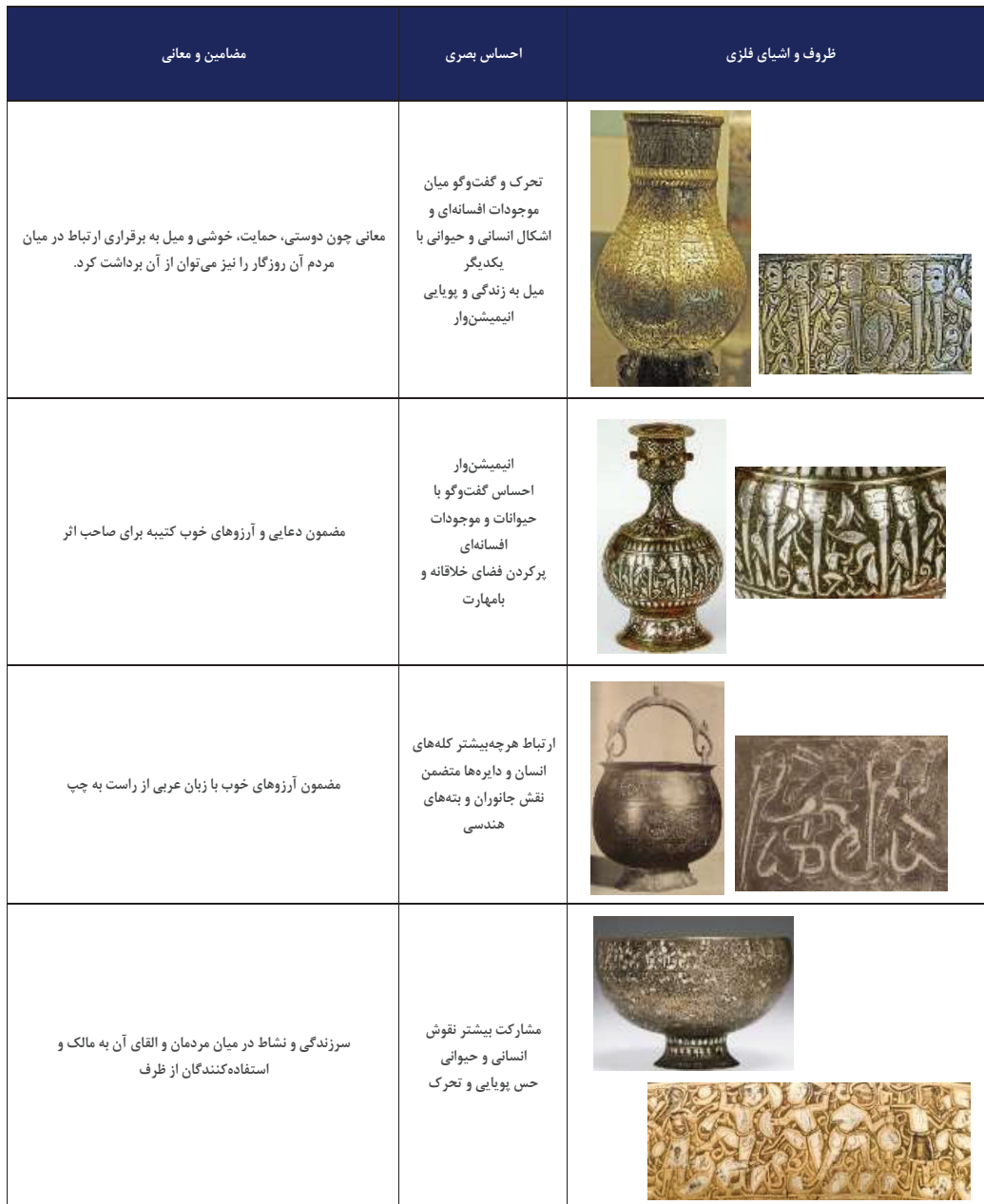
جدول ۱- بررسی بصری و مضامین و معانی کتیبه‌های انسان-خط» در آثار فلزی دوره سلجوقی.

این نقوش را به‌هم مرتبط می‌کند» (پوپ، ۱۳۸۰، ۸۴) (تصویر ۳). یکی از زیباترین و پیچیده‌ترین این کمپوزیسیون‌ها را می‌توان در کاسه (جام) برنجی مشاهده کرد که در آن نیز کتیبه با مضمون آرزوهای خوب با زبان عربی از راست به چپ نوشته شده است. در کتیبه تصویری این جام مشارکت بیشتر نقوش انسانی و حیوانی در پدیدآوردن حروف نوشتاری مشاهده می‌شود. این خط‌نگاره نیز