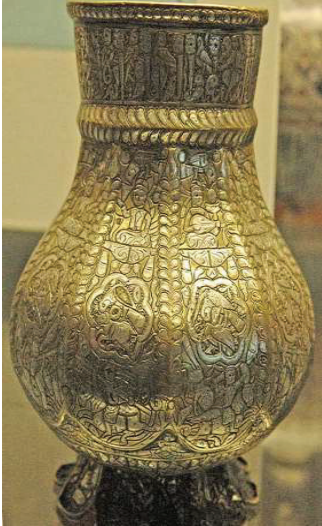
تصویر ۱- پارچ برنجی با رنگ طلایی برنج، مرصع‌کاری شده با نقره، ارتفاع ۱۵/۳ سانتی‌متر، هرات، حدود ۱۲۰۰/۵۹۷ (وارد، ۱۳۸۴، ۳۳).

در بعضی از این نقوش تحرک و پویایی بیشتری از صورت‌های انسانی و درگیر شدن بیشتر آن‌ها با خطوط نوشتاری را مشاهده می‌کنیم. «نظیر این نوع ترکیب‌بندی، ظرفی است متعلق به اواخر قرن ششم که دارای حروف کوفی با کله‌های انسان و دایره‌های زیبایی متضمن نقش جانوران زیباست و بته‌های هندسی زیبایی