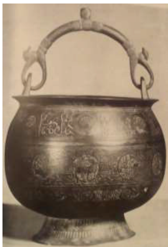
تصویر ۳- دیگ، مفرغ، کنده‌کاری و مرصع، قرن ششم، قطر ۲۰ سانتی‌متر، تالار هنری والترز، بالتیمور (یوپ، ۱۳۸۰، ۱۱۶).