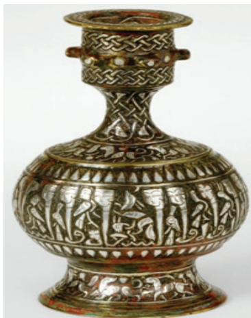
تصویر ۲- گلاب‌پاش برنزی و ریخته‌گری شده، حکاکی و منبت‌کاری شده با نقره، شرق ایران یا افغانستان، ارتفاع: ۱۲/۸، قطر: ۷/۸ سانتی‌متر، ۱۲۰۰ میلادی، دوره سلجوقی، مأخذ: www.davidmus.dk