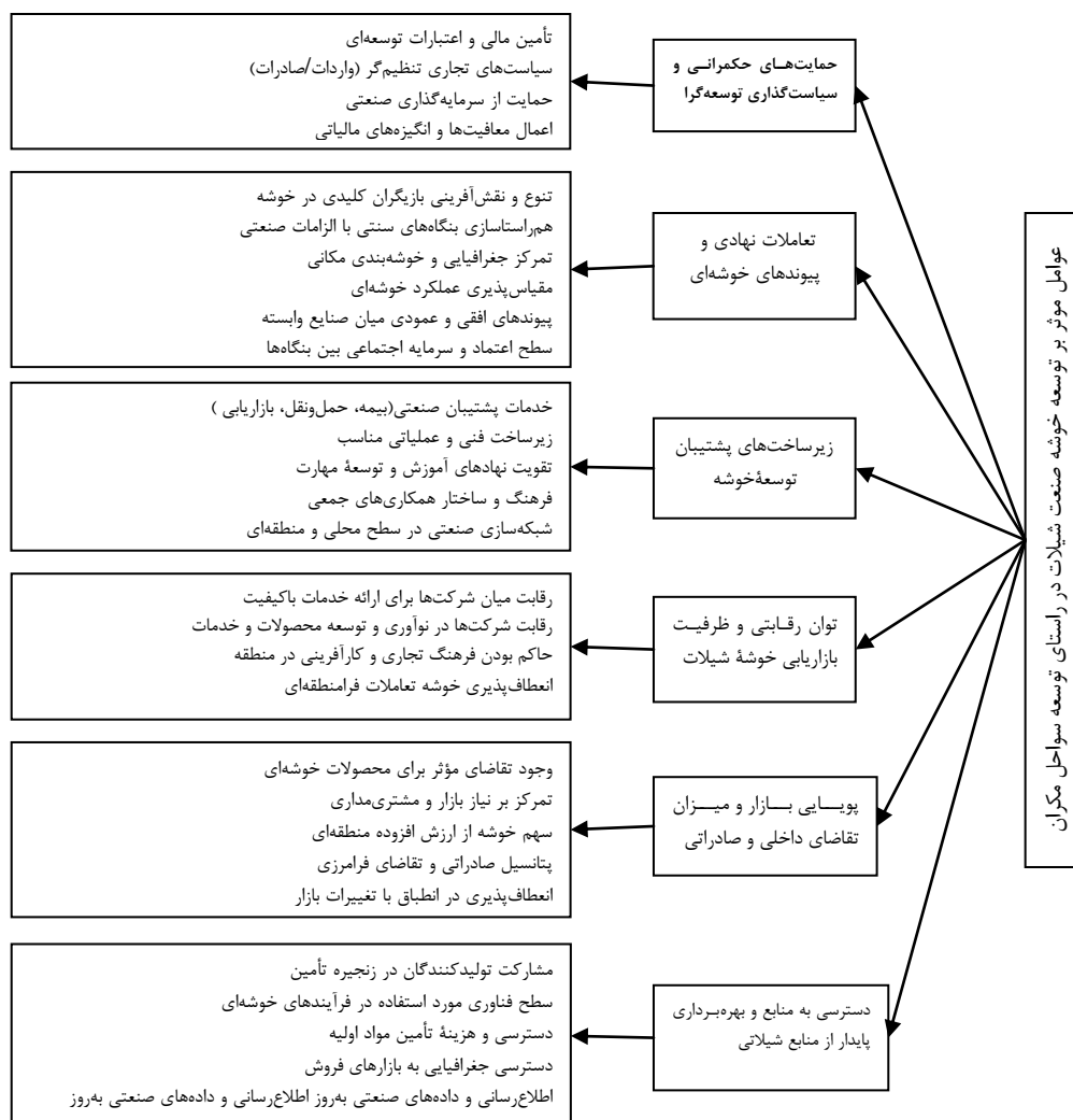
شکل ۱: درخت تحلیل سلسله‌مراتبی