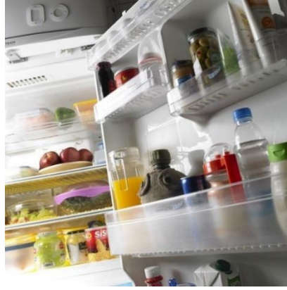
تصویر(۱۰): مجموعه هیچ،هیچ، اثر شادی قدیریان، سال تولید اثر: ۱۳۸۶