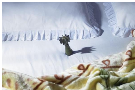
تصویر(۸): مجموعه هیچ،هیچ، اثر شادی قدیریان، سال تولید اثر: ۱۳۸۶