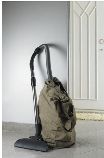
تصویر(۱۱): مجموعه هیچ،هیچ، اثر شادی قدیریان، سال تولید اثر: ۱۳۸۶