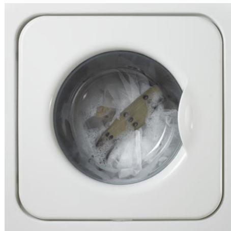
تصویر(۳): مجموعه هیچ،هیچ، اثر شادی قدیریان، سال تولید اثر: ۱۳۸۶