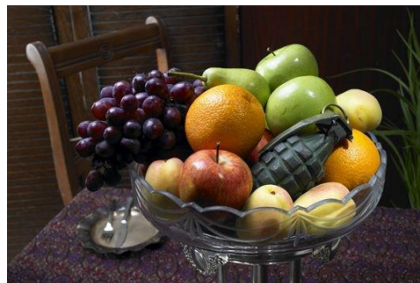
تصویر(۱۲): مجموعه هیچ،هیچ، اثر شادی قدیریان، سال تولید اثر: ۱۳۸۶