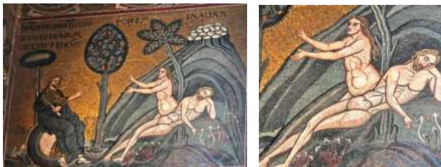
تصویر ۳: پیدایش، موزاییک، کلیسای جامع فرضیه مونریال سیسیلی، قرن ۱۲ تا ۱۳م. URL:3

آفرینش عرب دید: «برای آفریدن آدم نخست خاک را از زمین بر گرفتند، بعد آن را با آب آمیختند تا به گل بدل گشت و سپس به صورت پیکر انسانی درآمد. در مرحله دوم جفت او (حوا) از پیکری که حیات کاملاً انسانی داشت مشتق شد و به وجود آمد» (سیدی، علی‌پور، ۱۳۸۹: ۱۳۰ و ۱۳۲). در کتیبه تصویر (۳) چنین آمده است: خداوند آدم را به خواب برد و حوا را از دنده‌های خود بیرون کشید. خدا بر روی نماد جهان نشسته و در دست راستش طومار را نگه می‌دارد که نشان دهنده قدرت الهی است که او چنین کارهایی را انجام می‌دهد. براین اساس تعمیم متون الهی در تصاویر درخور توجه است.