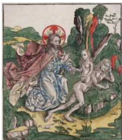
تصویر ۱: آفرینش حوا، نقاشی بر روی چوب، ۱۴۹۳، مایکل ولگموت و البرت دورر، فرانسه URL:1: گالری هنر درووت.

باتکیه بر متون تاریخی دوره اسلامی، همچون تاریخ بلعمی و تاریخ مقدسی «گاهی آدم را با کیومرث و آدم و حوا را مشی و مشیانه یکی می‌دانند و کیومرث را فرزند آدم می‌دانند» (مقدسی، ۱۳۷۴: ۳۷۲). همچنین مقدسی رتبه این دو را همان آدم و حوا در نزد اهل کتاب و دیگر امت‌ها می‌داند (همان، ۳۲۱). پرداختن به داستان آفرینش به خودی خود از اسطوره‌ها، باورها و آیین‌های ابتدایی هر تمدن جدا نیست. به عنوان مثال، آفرینش کیومرث از سمت چپ اهورامزدا در اساطیر ایران و قصه مردوخ و گشودن دروازه‌هایی به سمت خاور و باختر در میان دنده‌های تیامت در اساطیر بابلی و