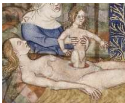
تصویر 7: تولد ژولیس سزار به روش سزارین، نسخه خطی تاریخ باستانی رومیان، قرن ۱۴م، کتابخانه سلطنتی بریتانیا. URL:5

با وجود اختلاف نظر در باب ارتباط سزار و سزارین، تادمن ۱ معتقد است، منشاء اصطلاح سزارین از تولد ژولیوس سزار است (Todman, 2007: 357). ظاهراً پلینی پیر ۲ (۲۳-۷۹م) اولین مورخ یونانی بود که افسانه رومی را که سزارین به نام زایمان ژولیوس سزار نام‌گذاری شده است، به وجود آورد (Barroso, 2013: 79). از این منظر می‌توان اظهار داشت که عبارت CS همیشه با گایوس