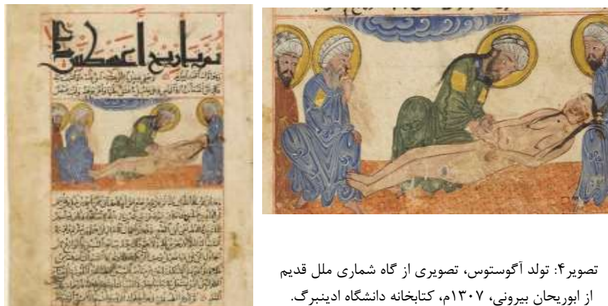
تصویر ۴: تولد آگوستوس، تصویری از گاه‌شماری ملل قدیم از ابوریحان بیرونی، ۱۳۰۷م، کتابخانه دانشگاه ادینبرگ.