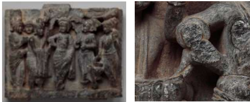
تصویر ۸: تولد بودا ساکیامونی، پنل سنگی، قرن دوم، موزه متروپولیتن. URL:6

در فرهنگ بودیسم مرگ مادر پس از عمل سزارین را نیک می‌پنداشتند و به مفهوم خلوص و پاکسازی است. در کتاب‌های مذهبی هندی تولد بودا را از طریق جناح راست مادرش، مایا، توصیف می‌کنند. بنا بر شواهد، دانش و عمل این نوع روش در یونان باستان، روم باستان و حتی هند باستان انجام شده است (Bali, Utaal, 2009:296). که در تصاویر (۸) تا (۱۱) به خوبی آشکار است.