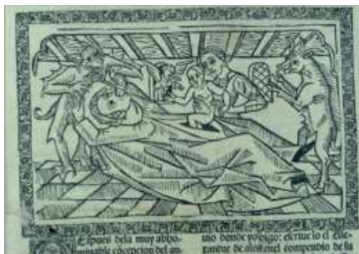
تصویر ۶: چوب تراشی قرن پانزدهم-تولد دجال از طریق (van dangen, 2009: 64) سزارین. منبع:

تصویر (۵) نحوه تولد اسکلیپیوس با شیوه CS توسط پدرش آپولو ۱ را نشان می‌دهد (Van dangen, 2009: 63). اسکلیپیوس در اساطیر یونان خدای پزشکی و درمان است (همان: ۶۲). که برخی مردگان را زنده می‌کرد (طاهری، ۱۳۹۳: ۳۰). از این منظر به عنوان طبیب افسانه‌ای یونان باستان نامیده شد.