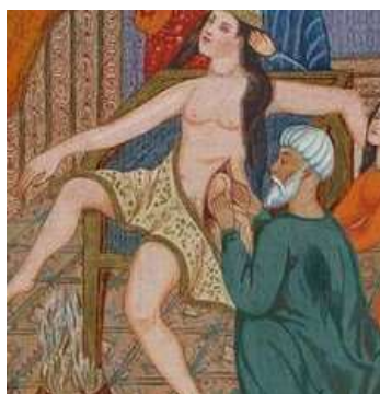
تصویر ۱۲: تولد رستم، ۱۶۲۰. کتابخانه عمومی