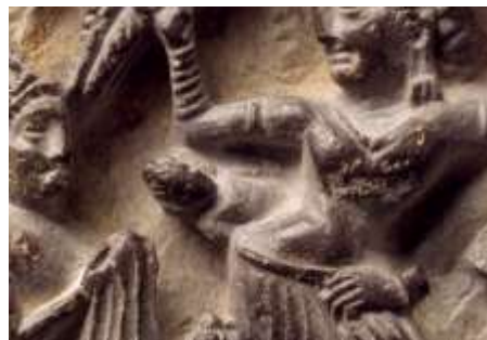
تصویر ۹: تولد و مرگ بودا، پنل از معبدی در گاندارا، قرن ۵ و ۶ موزه متروپولیتن. URL: 7

سیدارتا در زمان تغییرات اجتماعی عمیق در هند زندگی می‌کرد و در سن ۲۹ سالگی، متوجه شد که ثروت، نمی‌تواند با خود، آگاهی، شادی و سعادت بیافریند. او با کشف آموزه‌های ادیان و فلسفه‌های مختلف زمان خود، نقطه عطف خوشبختی انسان را پیدا کرد. پس از شش سال مطالعه "راه میانی" ۱ را کشف کرد و به آگاهی و روشنگری دست‌یافت. زین‌پس بودا بقیه زندگی خود را صرف آموزش اصول بودایی، دهاما ۲ یا حقیقت کرد تا اینکه در سن ۸۰ سالگی درگذشت (Tavares, 2021: 49).