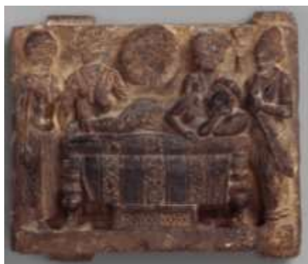
تصویر ۱۱: فیل سفید در خواب ملکه مایا؛ مادر بودا، قرن دوم، موزه متروپولیتن، URL:9

بر طبق اساطیر هند مایا در ابتدا خواب چهار پادشاه الهی را دید که توسط ملکه‌های آنها با آب دریاچه آنوتاتا، به منظور پاک شدن از ناخالصی‌های انسانی ۱ تطهیر شده‌است. سپس مایا رویای یک فیل شش دندان را می‌بیند که از آسمان فرود می‌آید تا از طریق سمت راستش وارد رحم او شود. در (تصویر ۱۱) یک فیل کوچک در دیسک مرکزی شکسته نشان داده شده است-