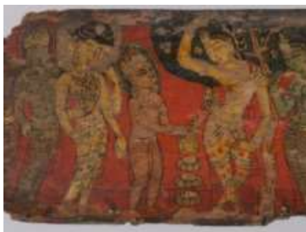
تصویر ۱۰: جلد نقاشی شده از نسخه خطی برگ نخل، قرن ۱۰ و ۱۱، موزه متروپولیتن، URL:8