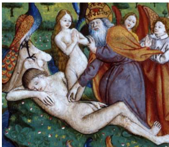
تصویر ۲: آفرینش حوا و اخراج آدم و حوا از بهشت، جوهر بروی پوست، ۱۴۹۳-۱۴۳۰، موزه هنر والترز.