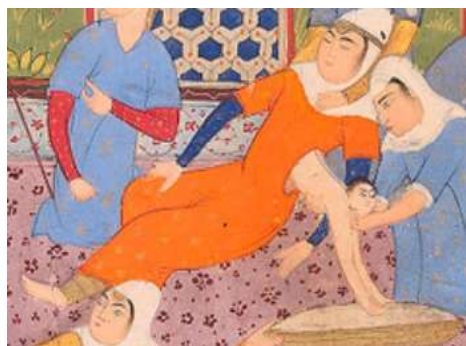
تصویر ۱۳: تولد رستم، شاهنامه فردوسی، ۱۶۰۱، کتابخانه بادلین، ص ۷۳. URL: 11