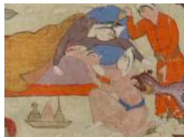
تصویر ۱۴: تولد رستم، شاهنامه فردوسی، کتابخانه عمومی نیویورک، (URL: 12)

در جای دیگر فردوسی انجام عمل جراحی را تبیین می‌نماید: