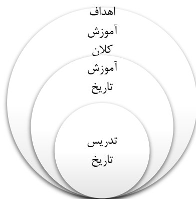
شکل ۱. اهداف آموزشی کلان، آموزش تاریخ و تدریس تاریخ در یک نگاه

گرچه پژوهش‌های متعددی در حوزه‌های مرتبط با آموزش تاریخ وجود دارد، اما فقدان رویکرد‌های تبیینی از یکسو نبود مطالعات مساله محور نشان می‌دهد کماکان نسب میان «آموزش تاریخ» و «تدریس تاریخ» در سطح گفتمان عمومی مغفول مانده است. علاوه بر این تعارض اصلی اینجاست که از یکسو آموزش تاریخ به‌مثابه پروژه‌ای ایدئولوژیک با هدف ملی‌گرایی، تربیت شهروند مطیع، و ترویج باستان‌گرایی و قوم و نژادگرایی طراحی می‌شد، و از سوی دیگر در سطح عمل معلمان و نویسندگان مقالات در مجلات و روزنامه‌ها، پرسش‌هایی بنیادین درباره ناکارآمدی روش‌های تدریس، عدم پیوند تاریخ با زندگی روزمره مردم، و ضرورت پرورش تفکر انتقادی و تخیل تاریخی مطرح می‌گردید. این تضاد میان خط مشی رسمی و کلان آموزش تاریخ و تجارب عملی و نقدهای روزنامه‌نگاران و صاحب‌نظران موجب پدید آمدن یک میدان چالش‌برانگیز شد که تاکنون کمتر مورد واکاوی قرار گرفته است. بنابراین ابهام اصلی پژوهش حاضر در شناسایی و تحلیل همین شکاف است و اینکه مجلات و روزنامه‌ها چه راهبردها و رهیافت‌های متفاوت یا حتی متعارضی در قبال آموزش و تدریس تاریخ ارائه دادند، و این رویکردها چه نسبتی با نیازهای جامعه تربیتی داشته‌اند؟ این پژوهش متکی بر روایت‌های تاریخی مندرج در نشریات مورد نظر با رویکرد توصیفی و تحلیل انتقادی سامان یافته است.