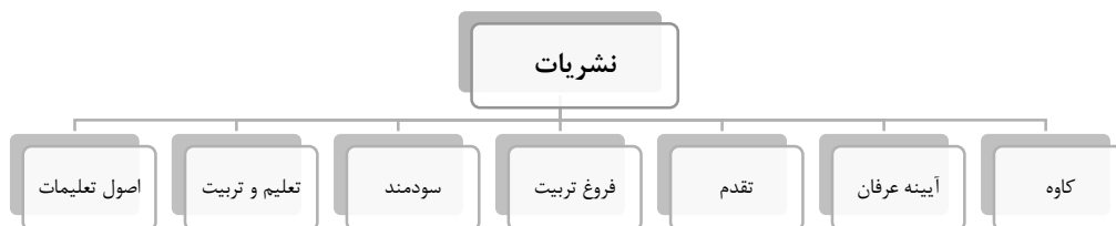
شکل ۳. نشریات مورد بررسی در تحقیق حاضر

شایان توجهی کردند. در نهایت، آموزش تاریخ در این دوره به ابزاری برای آگاهی‌بخشی و شکل‌دهی به نگرش‌های جدید تبدیل شده است، محققان با رویکرد تحلیل به‌دنبال کشف واقعیت هستند.