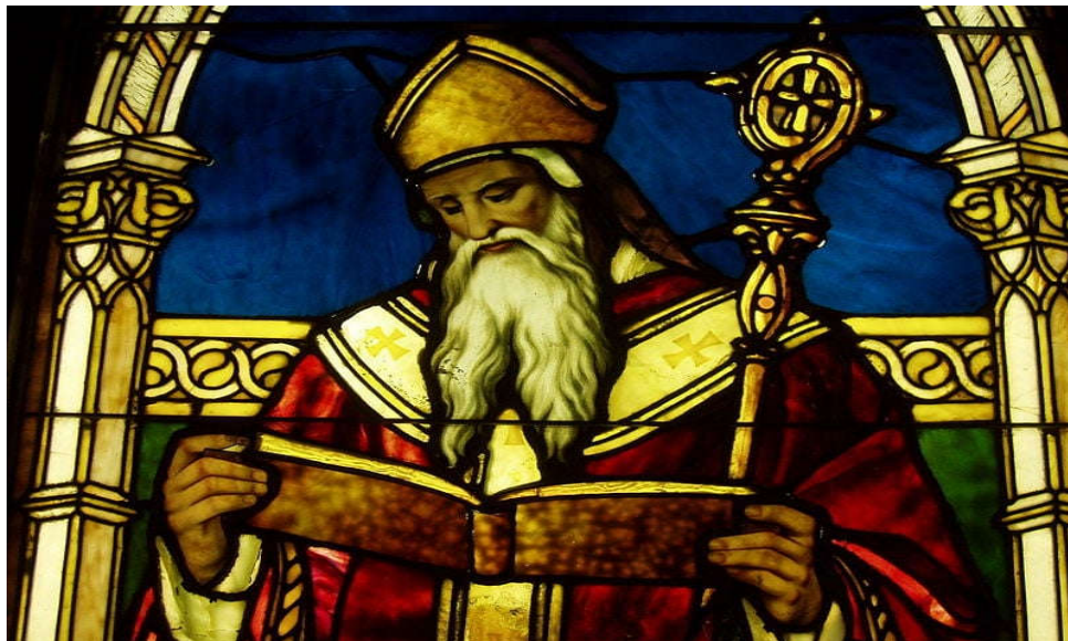
St. Augustine was originally a Manichaean.