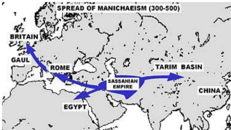
The spread of Manichaeism (300–500 C.E.)