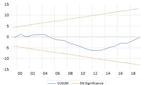
شکل ۲: آزمون ثبات ضرایب CUSUM