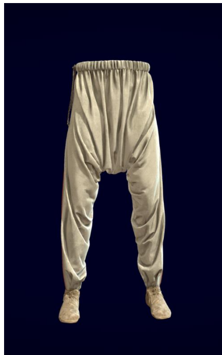
تصویر ۷- بازسازی دیجیتال سه‌بعدی کامل از پوشاک مرد نمکی شماره ۴ (۴۰۵-۳۸۰ قبل از میلاد)