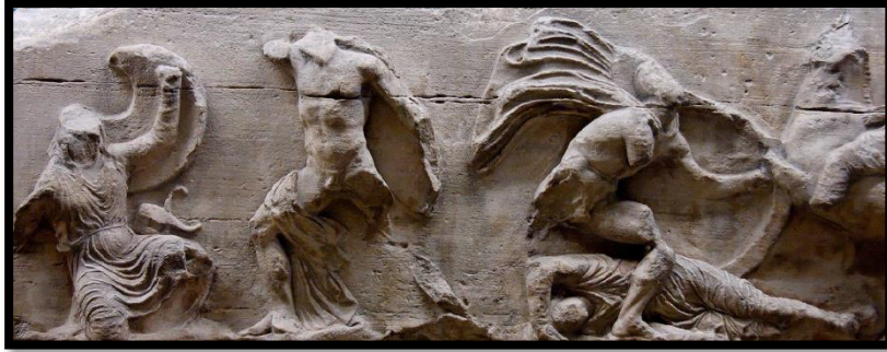
تصویر ۳- یونان، آکروپولیس، معبد آتنا نیکه. جنگ سربازان اسکندر با سربازان ایرانی

( https://digital.library.cornell.edu/catalog/ss:945945 )