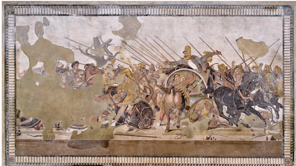
تصویر ۲- موزائیک اسکندر، جنگ داریوش سوم با اسکندر مقدونی (Beşikçi, 2023: 67)

متوپ‌های یونانی، به ویژه در معبد آتنا نیکه، یکی از مهم‌ترین منابع تصویری دوران کلاسیک برای شناخت چگونگی درک و بازنمایی ایرانیان توسط یونانیان محسوب می‌شوند (Boardman, 1985: 92-99). این آثار عمدتاً روایت‌گر ستیز میان جهان یونانی و جهان ایرانی بشمار می‌روند و پوشاک، برجسته‌ترین نشانه تمایز فرهنگی در این بازنمایی است (Miller, 1997: 54-60). عمده این نقوش برجسته زمانی شکل گرفت که یونانیان در جنگ با خشایارشا هخامنشی موفق به شکست او شدند. از این رو، شرح این پیروزی‌ها برای آنان بسیار مهم بود و در نشان دادن آن بسیار کوشیدند. در متوپ‌های مربوط به «نبرد آمازون‌ها» و «نبرد با پارسیان»، پوشاک ایرانیان معمولاً شامل عناصری مانند شلوارهای چین‌دار و تنگ (Anaxyrides)، کلاه‌های فریجی قلابدار به عنوان نشانه شرقی بودن، تونیک‌های بلند و پر چین و بندها و تسمه‌های تزئینی در کمر و سینه است (Miller, 1996: 112-118 & Llewellyn-Jones, 2013: 154-161).