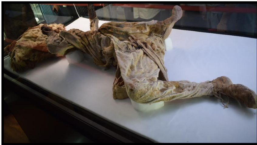
تصویر ۶- مرد نمکی شماره چهار