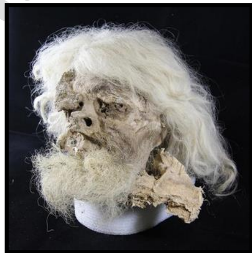
تصویر ۵- مرد نمکی شماره یک. موزه ملی (مردان-نمکی/ https://fa.wikipedia.org/wiki/ )