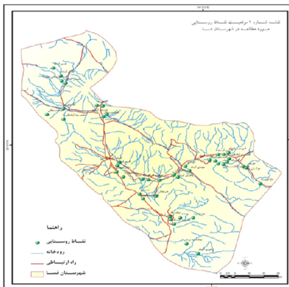
شکل ۳: نقشه پراکنندگی نقاط روستایی در محدوده‌ی تقسیمات سیاسی شهرستان فسا

د- تعیین وزن و درجه اهمیت خصوصیت‌ها: برای بیان اهمیت نسبی خصوصیت‌ها و معیارها باید وزن نسبی آنها را تعیین کرد. در این زمینه روش‌های متعددی مانند Linmap، AHP، ANP، آنتروپی شانون، بردار ویژه و مانند آن وجود دارند که متناسب با نیاز می‌توان آنها را مورد استفاده قرار داد. در این تحقیق از روش ANP برای تعیین وزن شاخص‌ها استفاده شده است.