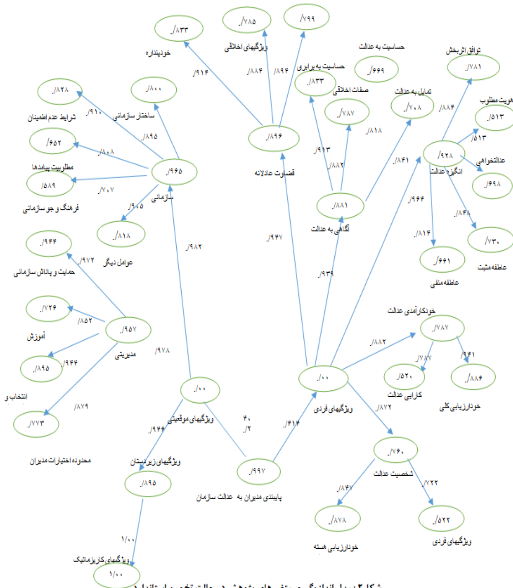
شکل ۲: مدل اندازه‌گیری متغیرهای پژوهش در حالت تخمین استاندارد