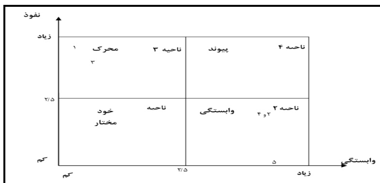
شکل ۲: نمودار قدرت نفوذ و وابستگی (منبع: یافته‌های محقق)