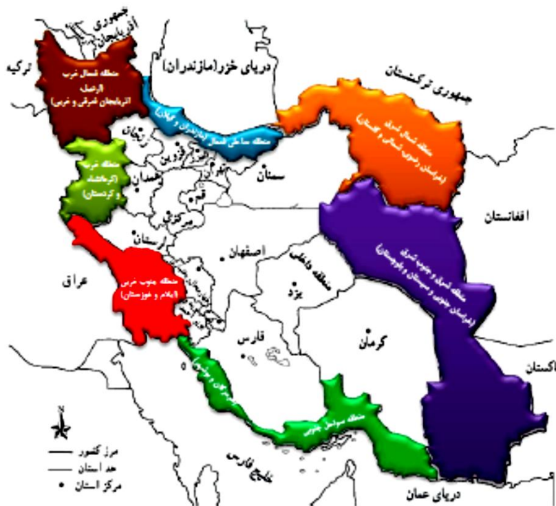
شکل ۲: پهنه‌بندی استان‌های مرزی کشور