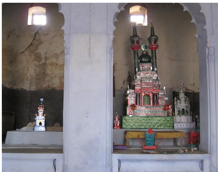
تصویر ۲. تعزیه (ضریح کوچک) در یک امام‌باره در کاخ راجای محمودآباد، محمودآباد، هند. تعزیه‌ها در هند زیارتگاه‌های کوچک و موقتی هستند که از کاغذ روشن و بامبو ساخته شده‌اند و صنعتگران آسیای جنوبی حداقل از قرن هجدهم شروع به ساخت آن‌ها کرده‌اند (www.journal18.org)

شیعیان هند نیز تحت تأثیر شیوه روضه‌خوانی ایرانی و به‌ویژه آشنایی‌شان با زبان پارسی، اشعار زیبایی سروده‌اند. مراسم روضه‌خوانی و نوحه‌خوانی از ایران به هند راه یافت. نوحه‌خوانی‌ها و نوحه‌سرایی‌ها در آغاز به زبان فارسی انجام می‌شد. علمای دین، بازرگانان، هنرمندان و شاعران هر از گاهی از ایران به هند مهاجرت می‌کردند و هند را موطن خویش قرار می‌دادند و باعث می‌شدند تا هندی‌های مسلمان تحت تأثیر فرهنگ و شیوه عزاداری آنان قرار گیرند. صوفیانی که به هند مهاجرت کردند نیز بر غنای آیین محرم و «تعزیه‌داری» افزودند و باعث اهمیت عزاداری شدند.