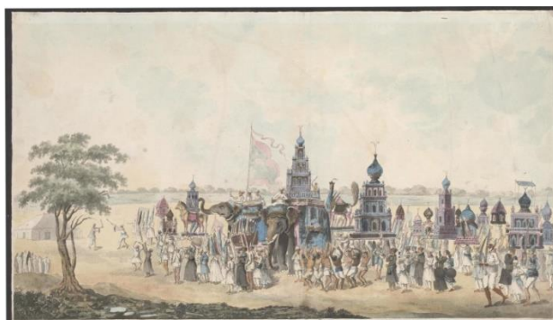
تصویر ۳. مراسم محرم و تعزیه‌گردانی در مرشدآباد یا کلکته هند، ۱۷۹۵-۱۸۰۵م، نقاشی آبرنگ روی کاغذ، موزة ویکتوریا و آلبرت، لندن