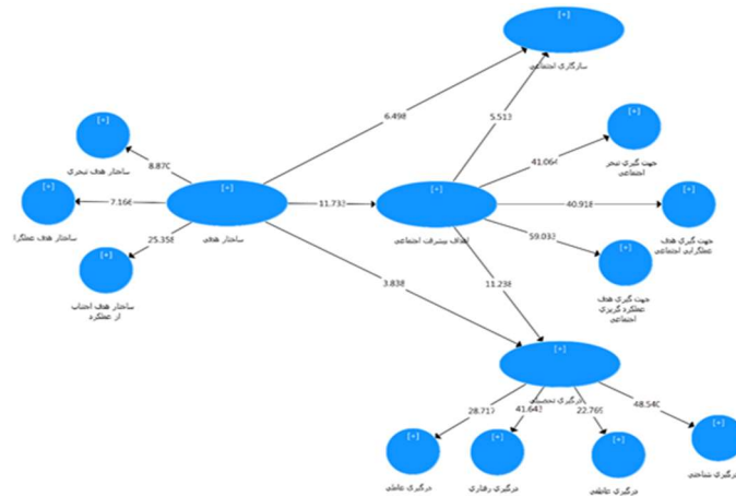
نمودار ۳. مدل پژوهش با ضرایب t-Values (ارزیابی مدل ساختاری)

نمودارهای ۲ و ۳ مدل‌های ساختاری را نشان می‌دهد، مدل‌های ساختاری در واقع روابط بین متغیرها را نشان می‌دهد و گویه‌ها را در نظر نمی‌گیرد، به همین علت گویه‌های مدل را مخفی نموده تا اصل مدل ساختاری با یک نگاه به مدل شناسایی شود و روابط بین متغیرها به روشنی نمایان گردد. در شکل ۲ اعداد روی فلش‌ها همان ضرایب مسیر و در شکل ۳ اعداد روی فلش همان مقادیر t-Values را نشان می‌دهد که بر اساس آن فرضیات تأیید یا رد می‌شود.