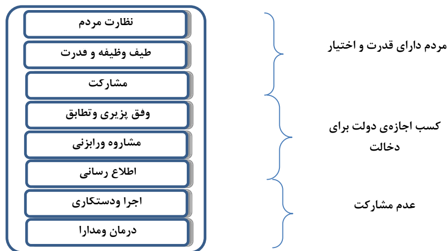
شکل شماره ۱: طرح نردبانی مشارکت (Aronstein, 2004: 2)

عضویت، تفویض اختیار و کنترل شهروند را در قالب قدرت شهروند دسته بندی کرد (Aronstein, 2004: 2).