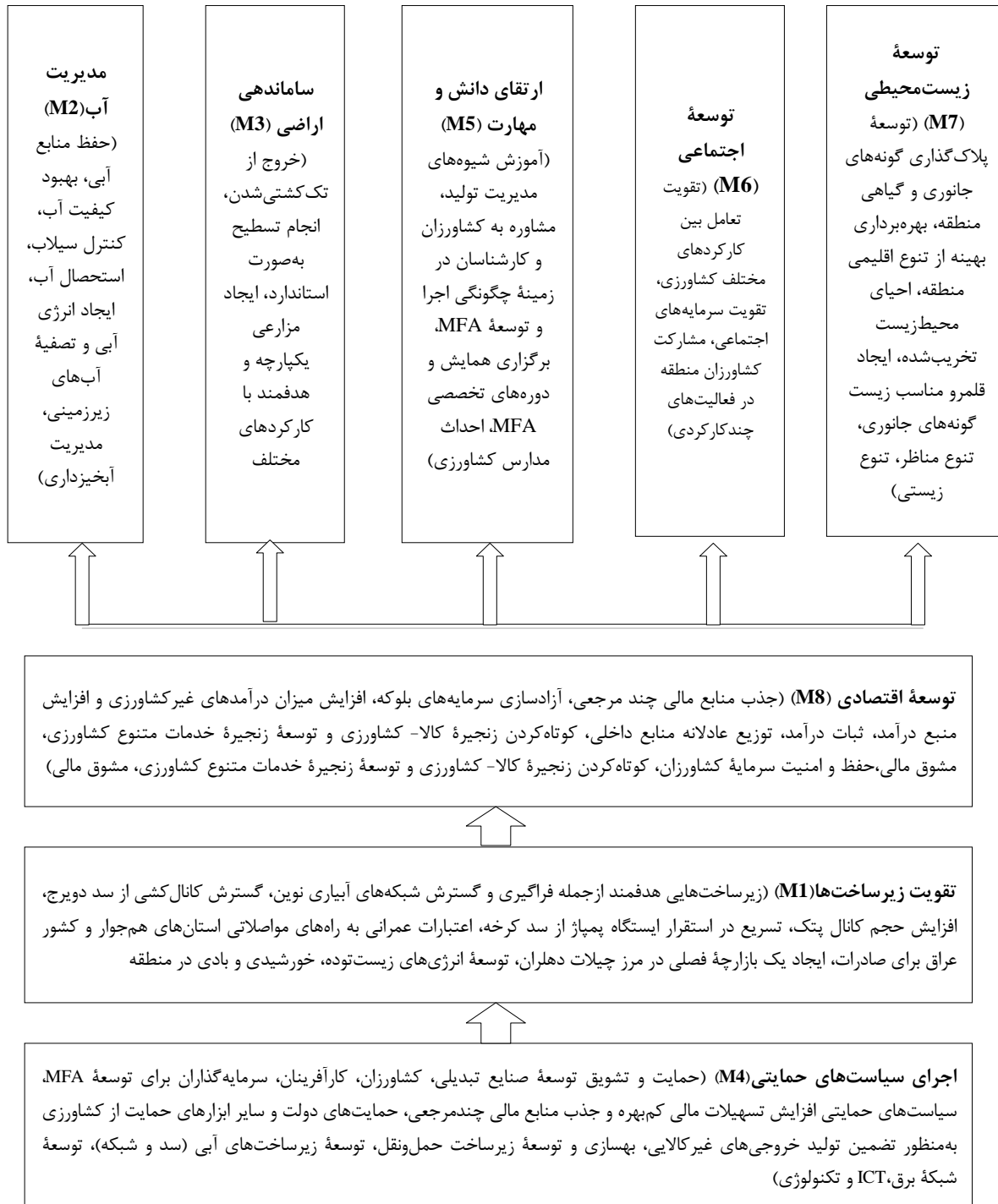
شکل ۲: سازوکار توسعه کشاورزی چندکارکردی در شهرستان دهلران با استفاده از تکنیک ISM