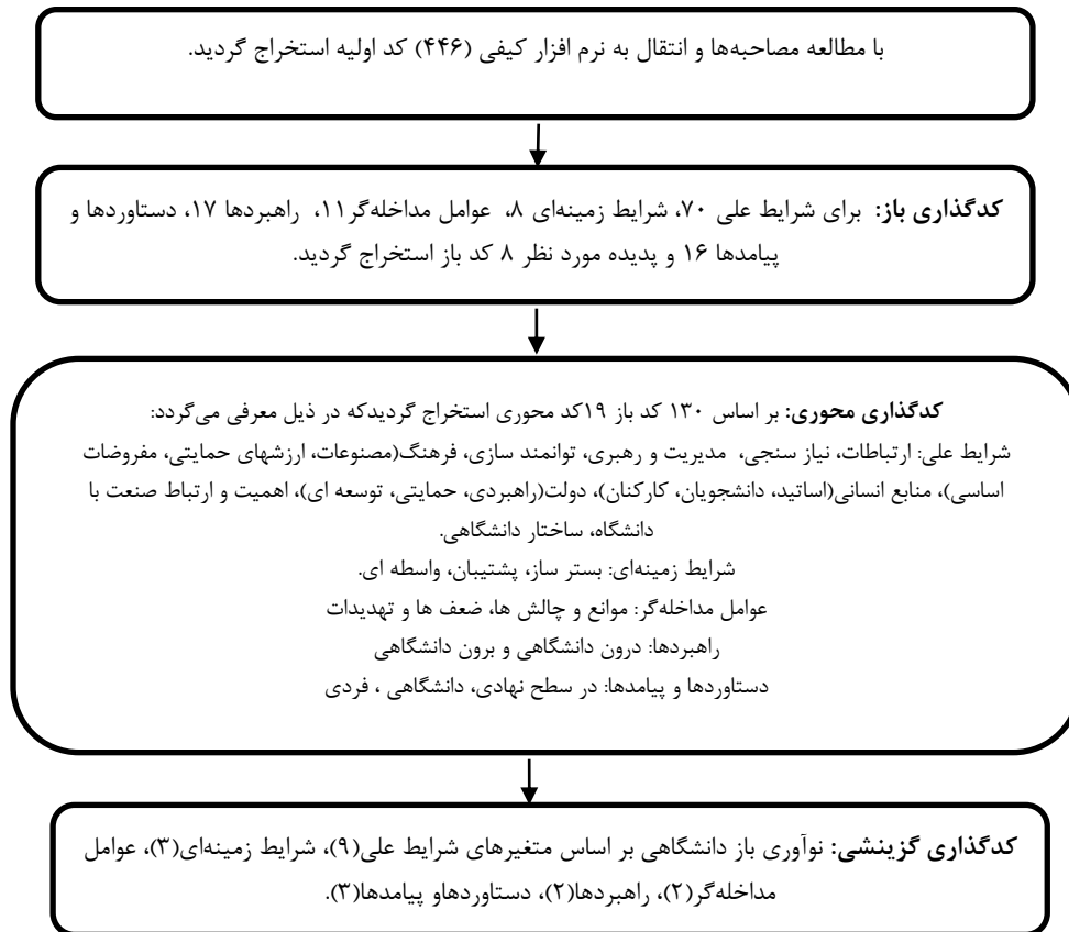
شکل شماره ۲: مدیریت داده در پژوهش کیفی نوآوری باز دانشگاهی

در این مقاله، شرایط علی نوآوری باز دانشگاهی شامل ارتباطات، نیازسنجی، مدیریت و رهبری، توانمندسازی، فرهنگ، منابع انسانی، دولت، اهمیت ارتباط صنعت با دانشگاه، ساختار دانشگاهی؛ شرایط زمینه‌ای نوآوری باز دانشگاهی، شامل شرایط بسترساز، شرایط پشتیبان، شرایط واسطه‌ای؛ عوامل مداخله‌گر در نوآوری باز دانشگاهی، شامل موانع و چالش‌ها، ضعف‌ها و تهدیدات؛ راهبردها و اقدامات شامل راهبرد درون دانشگاهی و برون دانشگاهی پیامدها و دستاوردها در سطح نهادی، دانشگاهی و فردی پدیده محوری نوآوری باز دانشگاهی را تبیین می‌کند.