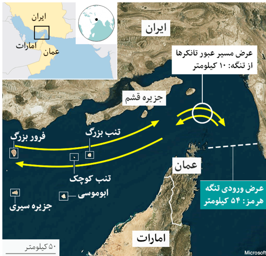
نقشه ۱: جیگاه جزایر سه‌گانه در خلیج فارس

باید توجه داشت که در قرن بیست‌ویکم، توسعه و امنیت یک رابطه همبستگی مستقیم با یکدیگر دارند؛ بدان معنی که هر اندازه که میزان توسعه‌یافتگی اقتصادی کم باشد، به همان میزان سطح امنیت کاهش می‌یابد و برعکس، هر اندازه میزان توسعه‌یافتگی اقتصادی زیاد باشد، به همان نسبت میزان امنیت افزایش می‌یابد. در همین راستا، توسعه‌یافتگی جزایر سه‌گانه می‌تواند به نوبه خود به افزایش امنیت در آن‌ها کمک شایانی بکند. در نتیجه، برای تثبیت حاکمیت ایران در این جزایر، باید به رابطه متقابل امنیت و توسعه در این مناطق توجه ویژه‌ای کرد.